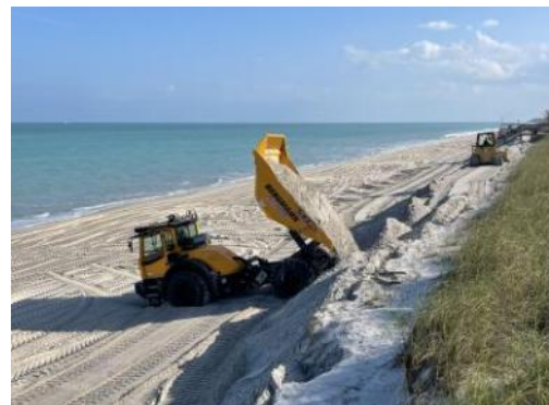
Figure 6 : Exemples d'équipement pour les travaux sur dune