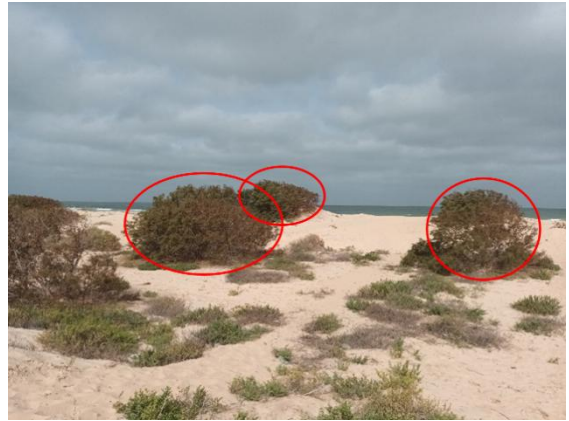
Figure 7 : Exemple de végétation « notable »

L'extraction de ces plants pourra également affecter les espèces fauniques animales (oiseaux, insectes, reptiles, petits mammifères) qui dépendent de cette végétation, entraîner la perte de végétation si celle-ci n'est pas manipulée et préservée efficacement et entraîner un déséquilibre des écosystèmes par réduction de la diversité floristique avec un risque d'augmentation de l'érosion modification de la structure du sol appauvrissement des nutriments.