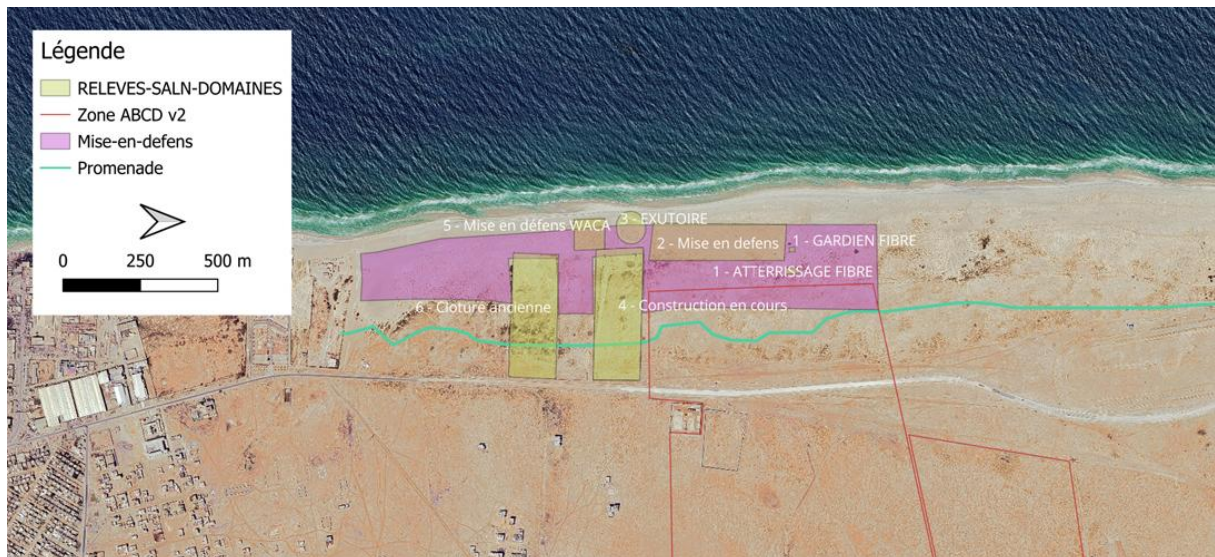
Figure 1: Emprises occupées dans la zone de mise en défens