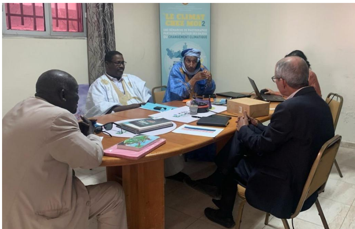
Figure 9: Rencontre du Directeur de Ciments de Mauritanie

Au total, environ 226 personnes ont été consultées, et les femmes étaient aussi représentées que les hommes. Toutefois, on notera que les femmes qui représentent des acteurs institutionnels ou privés sont rares.