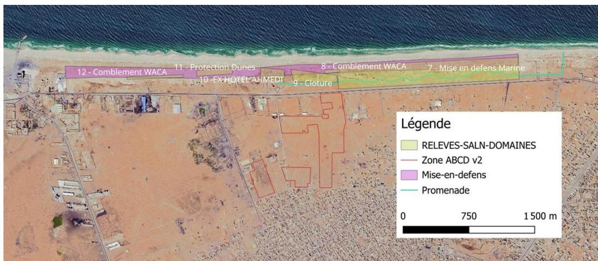
Figure 2: Emprises dans la zone de mise en défens B