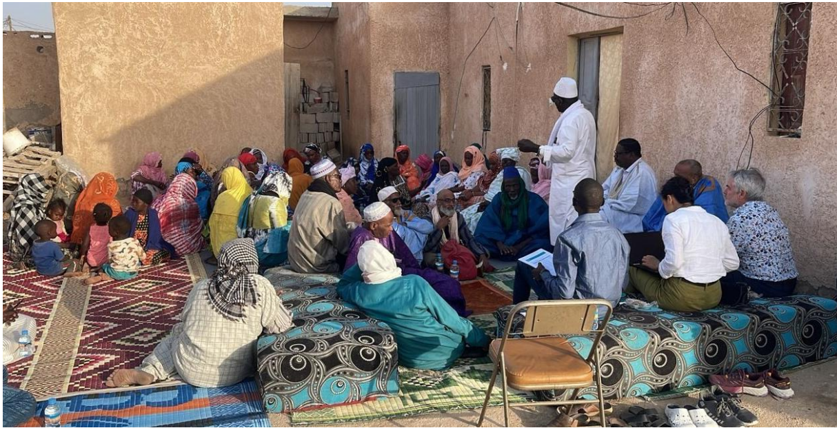
Figure 10: Consultation communautaire à El Mina

Il faut ajouter à ces consultations formalisées (ayant fait l'objet de compte rendus disponibles), des consultations plus informelles réalisées au gré des rencontres et qui n'ont pas pu faire l'objet d'un relevé précis et de compte rendus documentés. Néanmoins, les consultants ont tenu compte des informations recueillies de façon informelle dans leurs analyses et leurs propositions.