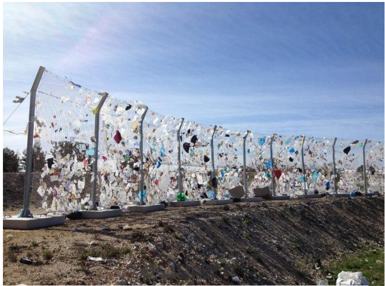
Figure 3: Filets attrape déchets