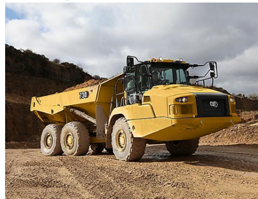
Figure 5: Exemple de tombereau

Des pelles mécaniques permettront alors de placer le sable au positionnement souhaité. Des bulldozers de petite taille pourront également aider à établir le profil du cordon et à organiser les stocks de sable.